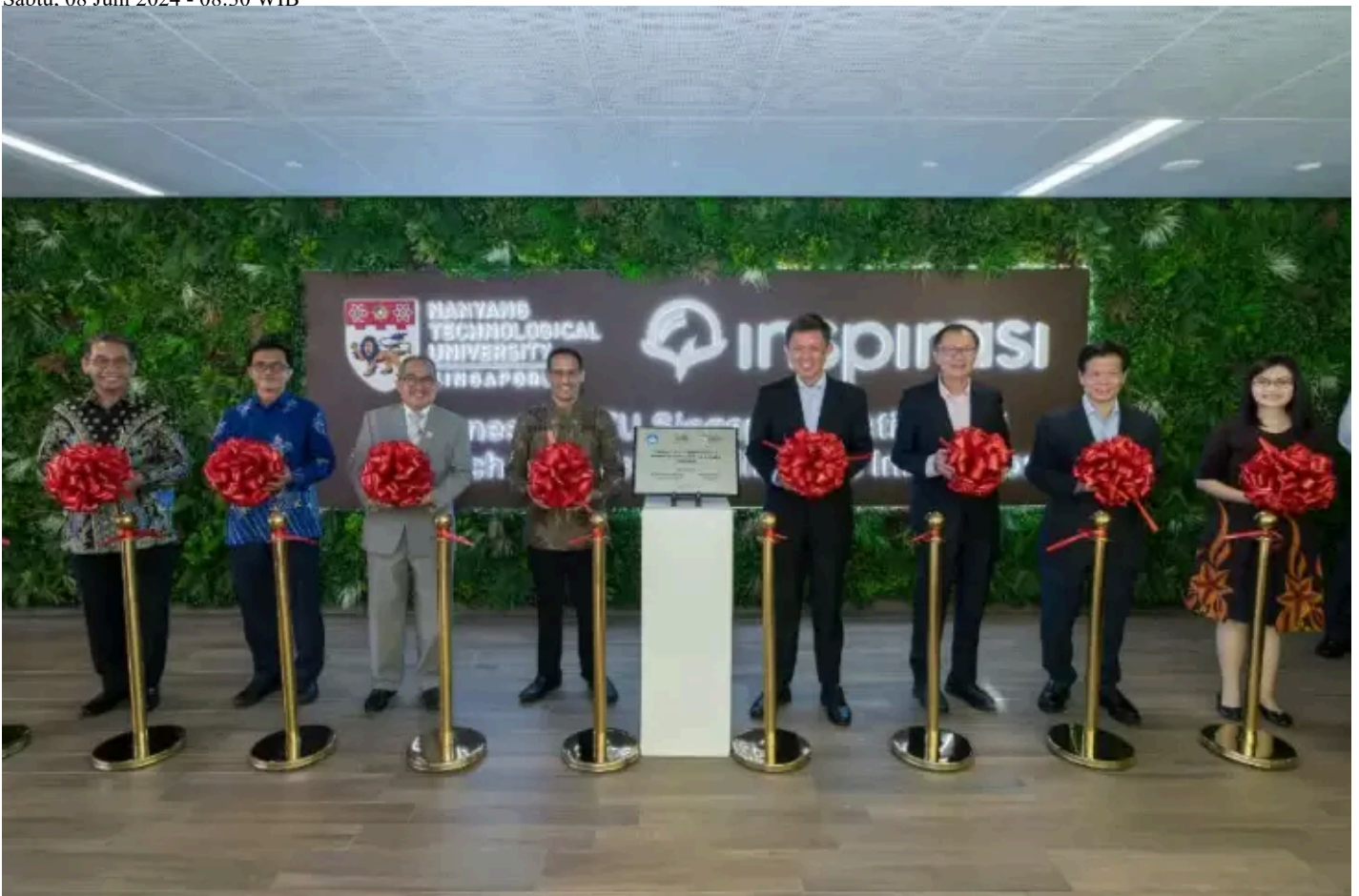
LPDP, Kemendikbudristek, dan Nanyang Technological University (NTU) Singapura berkolaborasi menyiapkan program beasiswa baru program Master.