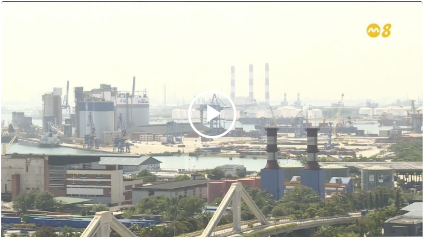
我国推出首个碳市场学院 为本地碳市场培训专才