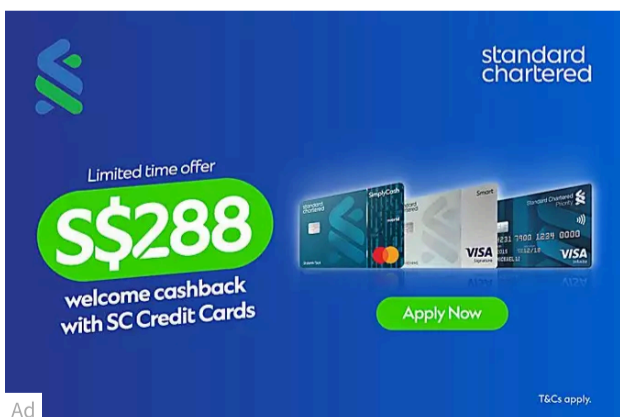
Get S$288 Cashback. T&Cs apply 3-month interest-free instalments with no processing fees with SC Smart Credit Card... Standard Chartered Bank