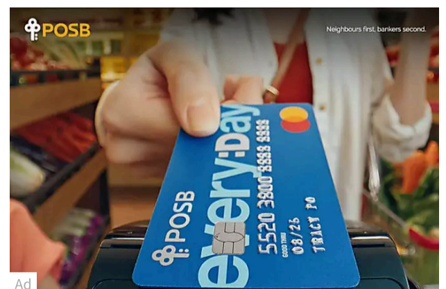
Enjoy up to 10% cash rebates on daily essentials and more POSB Bank Ltd.