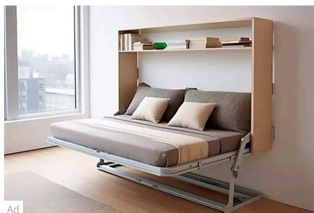
Space-Saving Beds That Will Transform Your Home - Prepare t... Folding Beds | Search Ads