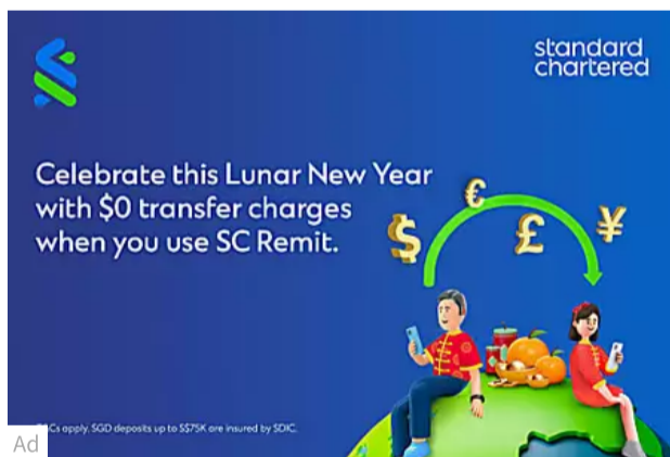
Send money to more than 50 countries at $0 transfer charges with... Standard Chartered Bank