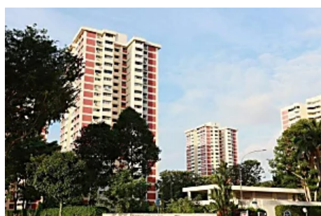
丈夫坠楼卡树上丧命 妻子满脸血痛哭