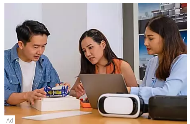
Beyond one-size-fits-all: Collaboration key to tackling challenges of adult... Business Times