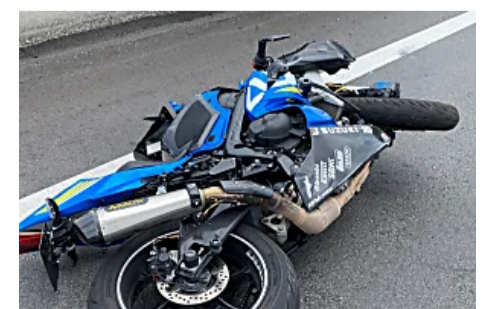
狮城男骑电单车游马国 疑打滑头重伤亡