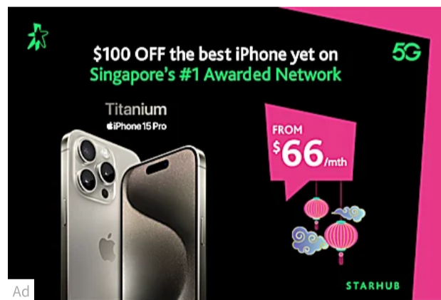
Save over $260 when you buy now pay later with our new SIM only Star... StarHub iPhone 15 Pro StarHub