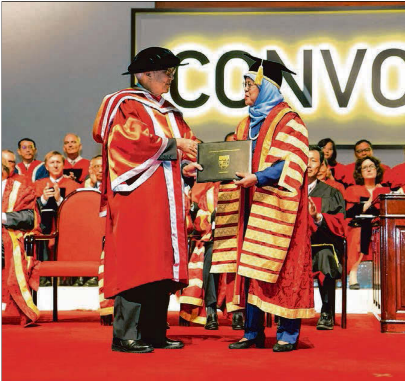
DIBERI IJAZAH KEDOKTORAN KEHORMAT: Mantan Presiden Singapura Dr Tony Tan Keng Yam (kiri) menerima ijazah kehormat daripada Presiden Singapura serta Canselor NTU, Puan Halimah Yacob, semasa majlis Konvokesyen NTU 2018 semalam.

MANTAN Presiden Singapura Dr Tony Tan Keng Yam telah diberi ijazah kehormat semasa majlis Konvokesyen Universiti Teknologi Nanyang (NTU) semalam.